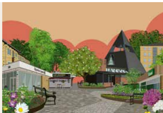
ILLUSTRATION: RIKKE JENSEN